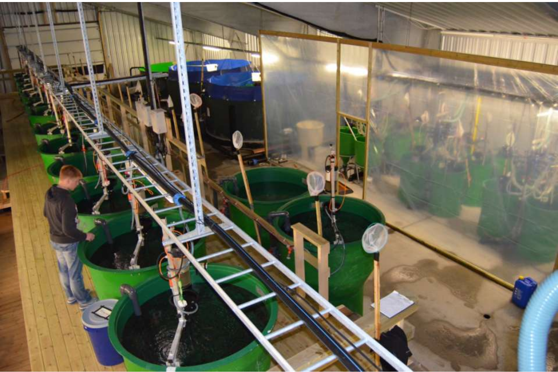
Arctic Cleanerfish AS, Lofoten